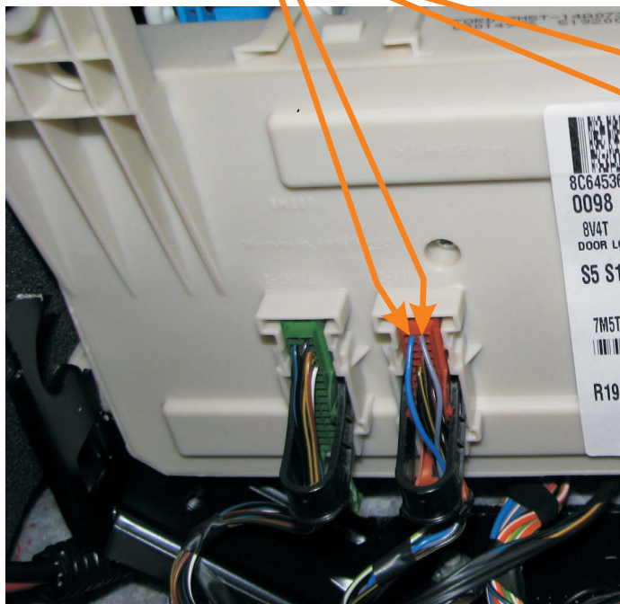
MODUŁ PRZÓD (pod schowkiem - strona pasażera)