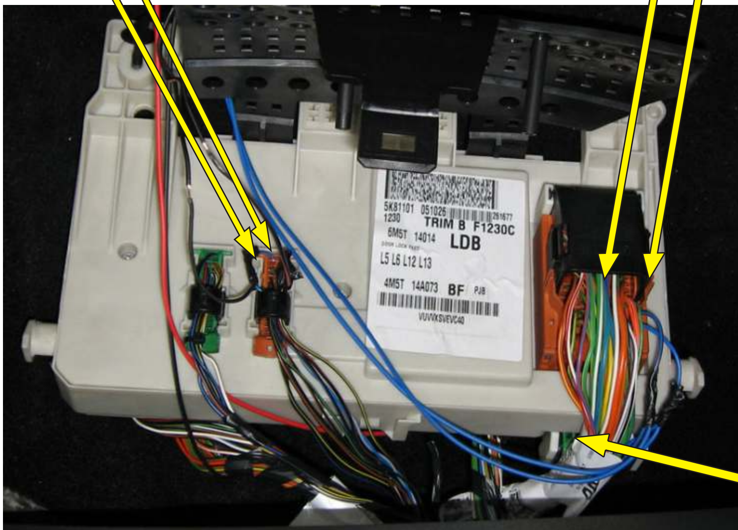
Komputer nad nogami pasa era